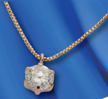
ダイヤモンド ペンダント (参)175,000円 (D:0.3ct)