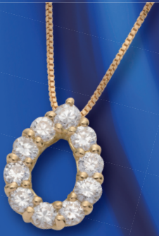
ダイヤモンド ペンダント (参)200,000円 (D:計0.3ct)